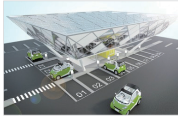
친환경 전기차 충전소