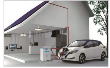
Smart Home 어플리케이션