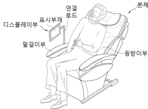
[건강관리장치의 디스플레이부를 나타낸 도면]

본 기술에 따르면 측정 및 치료에 따른 시간 및 비용을 절감할 수 있으며 병원과 같은 의료인이 있는 장소가 아닌 가정집과 같은 장소에서도 편리하면서도 전문적으로 건강관리를 할 수 있다.