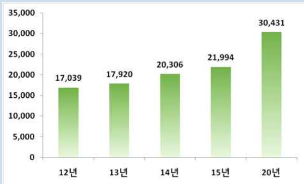
[그림] 국내 건강기능식품 시장현황 및 전망