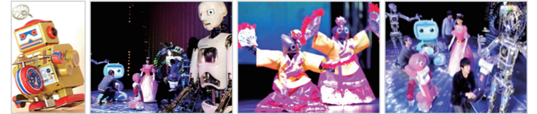
【 본 기술이 적용 가능한 공연용 로봇의 예시 】