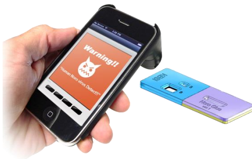
[그림3] 예상 제품 활용 예시