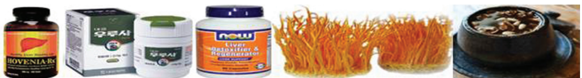
간 기능 회복제