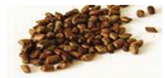
결명자 추출물을 이용한 당뇨 치료제