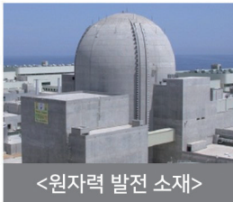
<원자력 발전 소재>

생활 안전 : 의료용 방사능 차폐소재, 및 우주/항공/국방용 방사능 차폐 소재