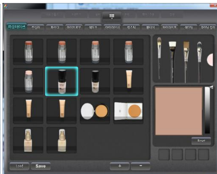
< Real palette UI >