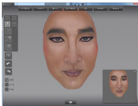
< Make-up Program UI >