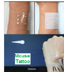
< 응용 예 : Mouse tattoo >