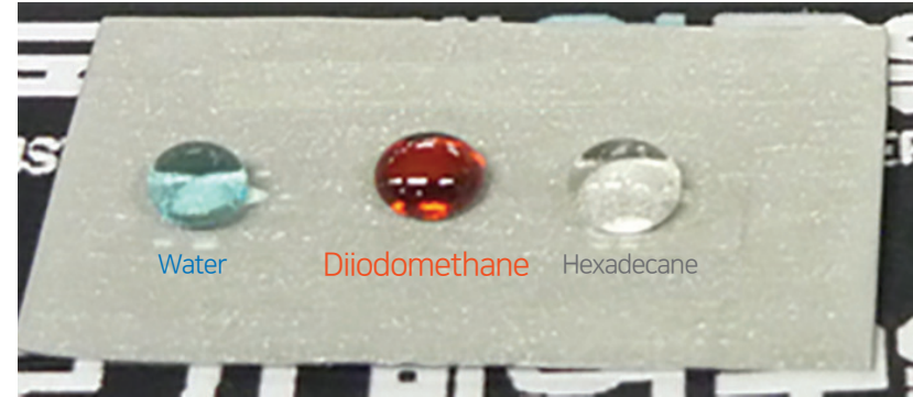
[ 초발수, 초발유특성을 보이는 알루미늄 표면 ]