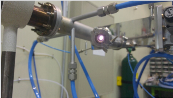
플라즈마 폐냉매제 분해 실험 사진 ▲