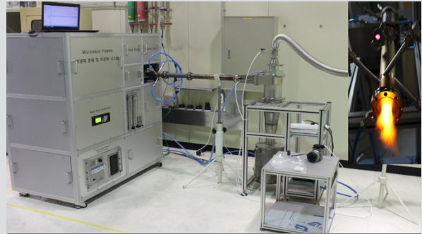
플라즈마 폐냉매제 분해 시스템 전체도 ▲