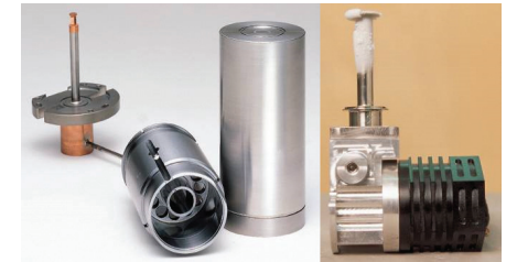
[센서 냉각용 스텐링 극저온 냉동기]